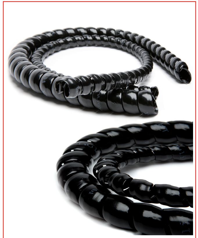
The spiral presents the "left" orientation. La espiral presenta orientación "izquierda".